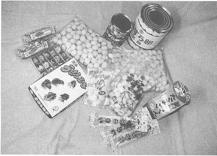
ウズラ農協で扱っている各種玉子製品

でもね、自然を見てご覧なさい。山、川、土、植物に動物。生態系や物質の循環系。こんな出来過ぎたものはないでしょう。指がスムーズに動く。こうして話している間にも舌を噛むことなく口も舌も動いているんです。ロボットでこんな出来過ぎたことがあるでしょうか？ 自然に学べば自然の摂理が働き、出来過ぎた自然のような結果が出て不思議ではないんです」