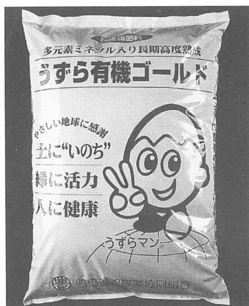
うずら有機ゴールド

かしウズラの無投薬飼育の実績から、農地も自然には違いないという大胆な発想でうずら有機ゴールドを使用し、土壌消毒なしで菊や大葉を定植していたできました。